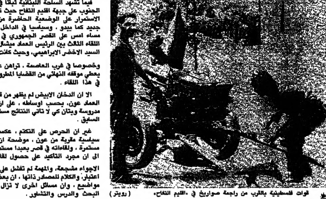
قوات فلسطينية بالقرب من راجمة صواريخ في اقليم الفلج

ابغ الرئيس السوري حافظ الاسد مبعوثاً كويتياً أمس حرص سوريا على عدم التصعيد وعلى حل الخلافات العربية عن طريق الحوار. وكان الرئيس الاسد قد استقبل أمس الدكتور عبد الرحمن العوضي وزير الدولة الكويتي لشؤون مجلس الوزراء، الذي سلمه رسالة خطية من الشيخ جابر الاحمد الصباح امير دولة الكويت، تتعلق بخلاف بين العراق والكويت. وقالت وكالة الأنباء السورية للانهاء من دون ان يتبين من حيثها نعت الكويت الالهامات العراقية بلها تسمى الى قول الخلف بين البلدين. وكان العراق قد اتهم الكويت بتصعيد المسألة لقرى اجنبية للتدخل في المنطقة. بعد ان سلم العوضي الكويتي في الأمم المتحدة رسالة بخلاف الى الأمين العام للأمم المتحدة بايير بييرس دي كوير. واعلنت الكويت ليلة امس الاول انها لم تطلب اتخاذ اي اجراء بوني من قبل الأمم المتحدة في ما يتعلق بتطور النزاع بينها وبين العراق. ونسبت وكالة الأنباء الكويتية، ان مصر كويتي مسؤول قوله ان الكويت عندما تقدمت بمشورتها الى الأمين العام للأمم المتحدة، كانت تهدف بذلك الى احاطة علماء بالخلاف تشبها مع الاعراف والمعارف الدولية المعتادة بهذا الشأن، من واقع التزام الكويت ببداية وحكم ميثاق الأمم المتحدة. وقال المصدر: وحول ما ورد في التصريح العراقي بان ذلك يمثل دعوة الى التدمير، فان الكويت تؤكد انها لم تتطلب على الاطلاق تزويرها (المكررة الكويتية) على الاضواء، او اتخاذ اي اجراء يشاها من جانب السكرتير العام للأمم المتحدة.